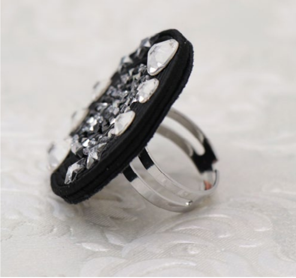
Anello Vortex Star