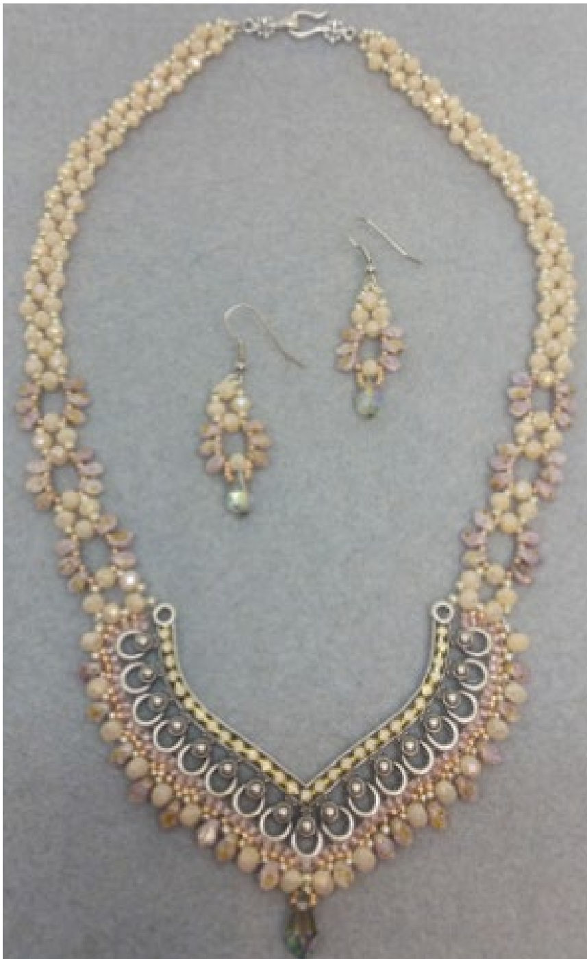
Collana e orecchini terminati.